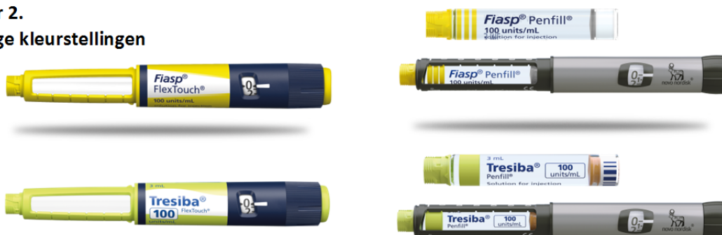
Figuur 2. Huidige kleurstellingen

Er zijn voorvallen gemeld waarbij patiënten per ongeluk de maaltijdinsuline Fiasp hebben toegediend in plaats van de basale insuline Tresiba vanwege de gelijkenis in kleur van de producten. In sommige gevallen hebben slechte lichtomstandigheden bijgedragen aan de verwisselingen.